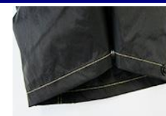
ホックボタン 調整機能