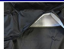
背中ベンチレーション