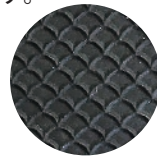
ウロコ形状 スベリ止め

2 独自の鱗(ウロコ)形状でグリップ力があり、インナーグリップも抜群で使いやすくなっています。